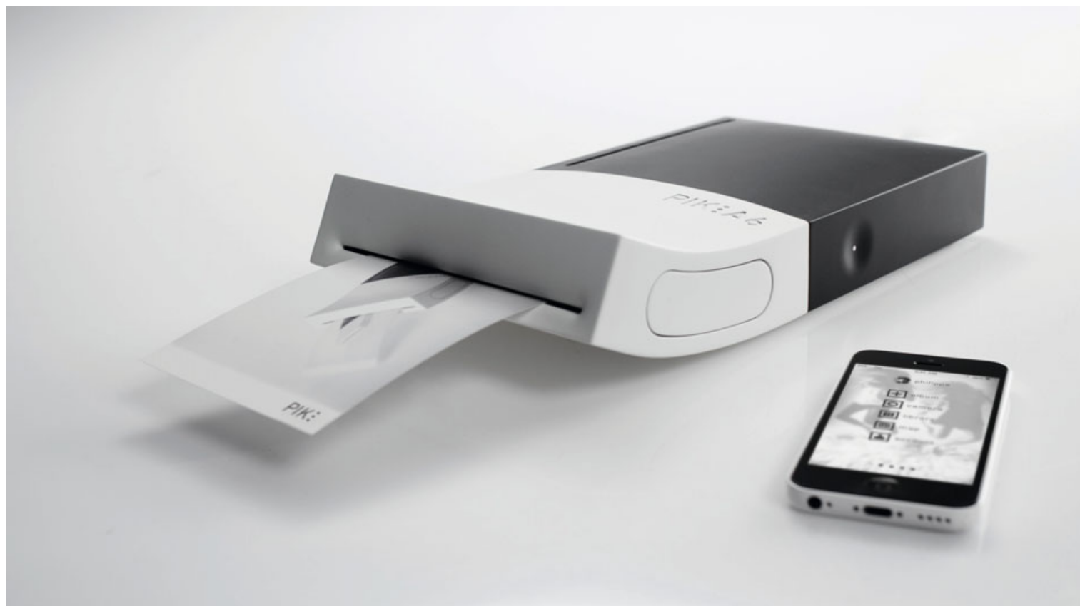
PIK A6 instant Fotodrucker – Schnell und einfach hochqualitative Bilder mit dem Handy drucken . PIK A6 instant photo printer – Print high-quality images quickly and easily with your phone